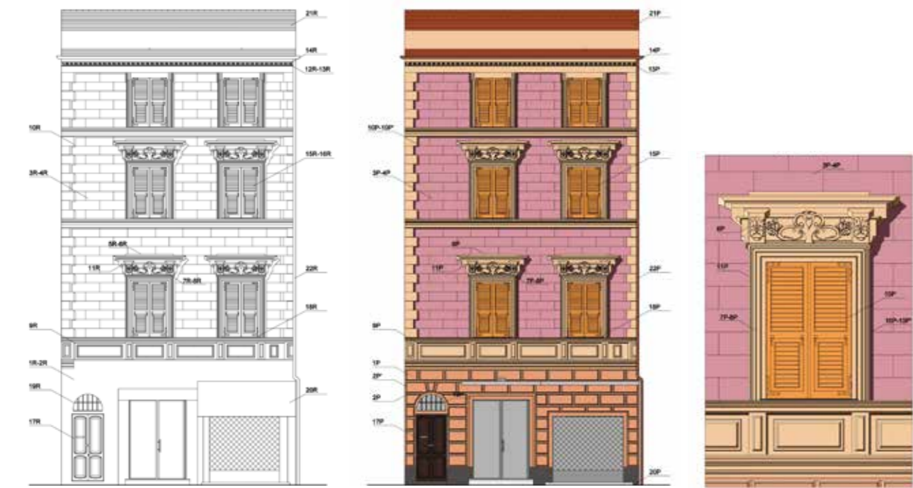
Rilievo e progetto architettonico - cromatico del prospetto principale dell'edificio di Via Mazzini 45/47/49

Il rilievo ha anche permesso l'individuazione di tecniche tradizionali quali l'affresco, la tinta a calce, il marmorino, l'intonachino pigmentato, il fresco secco e il falso secco. In alcuni casi queste preesistenze sono state confermate da indagini effettuate sui campioni di intonaco dipinto, prelevati dai fronti degli edifici facenti parte l'ambito , che hanno evidenziato una stratigrafia con almeno cinque tipi di intervento, tra i quali è stato possibile riconoscere strati realizzati con la tecnica del marmorino, coloriture antiche sovrapposte e velature.